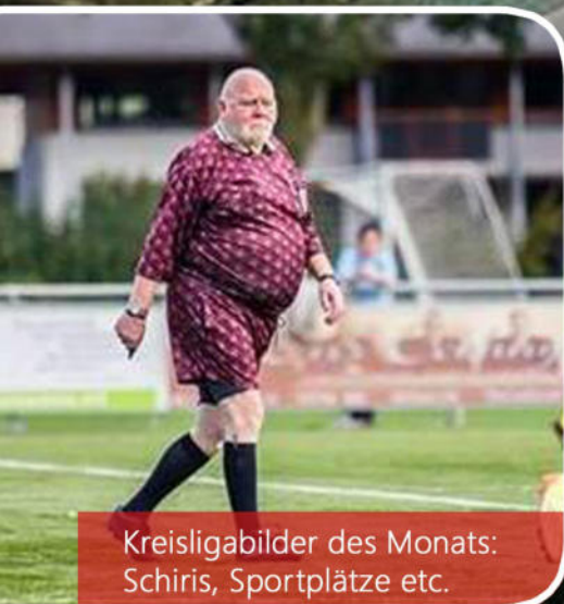
Kreisligabilder des Monats: Schiris, Sportplätze etc.